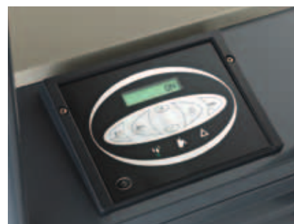
Un écran simple d'utilisation placé sur le dessus de l'appareil facilite les opérations.