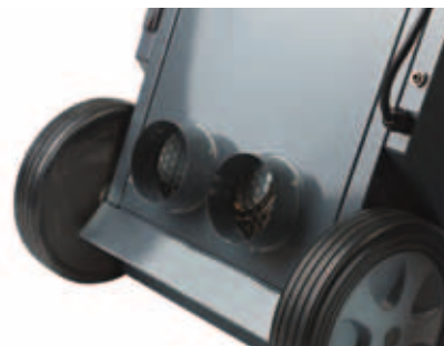
Le CDT 30 S et le CDT 40 S sont équipés d'un corps de chauffe d'1 kW et d'un ventilateur à haute pression permettant le raccordement de deux gaines flexibles de Ø100 et d'une longueur de 5 m chacune.

Les déshumidificateurs CDT Dantherm jouissent d'une excellente réputation dans l'industrie du bâtiment, en raison de leur conception ergonomique et de leur mobilité. Ce sont des solutions efficaces et rigoureusement contrôlées pour assécher les murs de briques ou en béton, permettant de gagner du temps et de réaliser des économies, sans forcer le processus de façon excessive. Par ailleurs, les déshumidificateurs CDT sont conçus de manière à satisfaire aux exigences modernes de faible consommation énergétique.